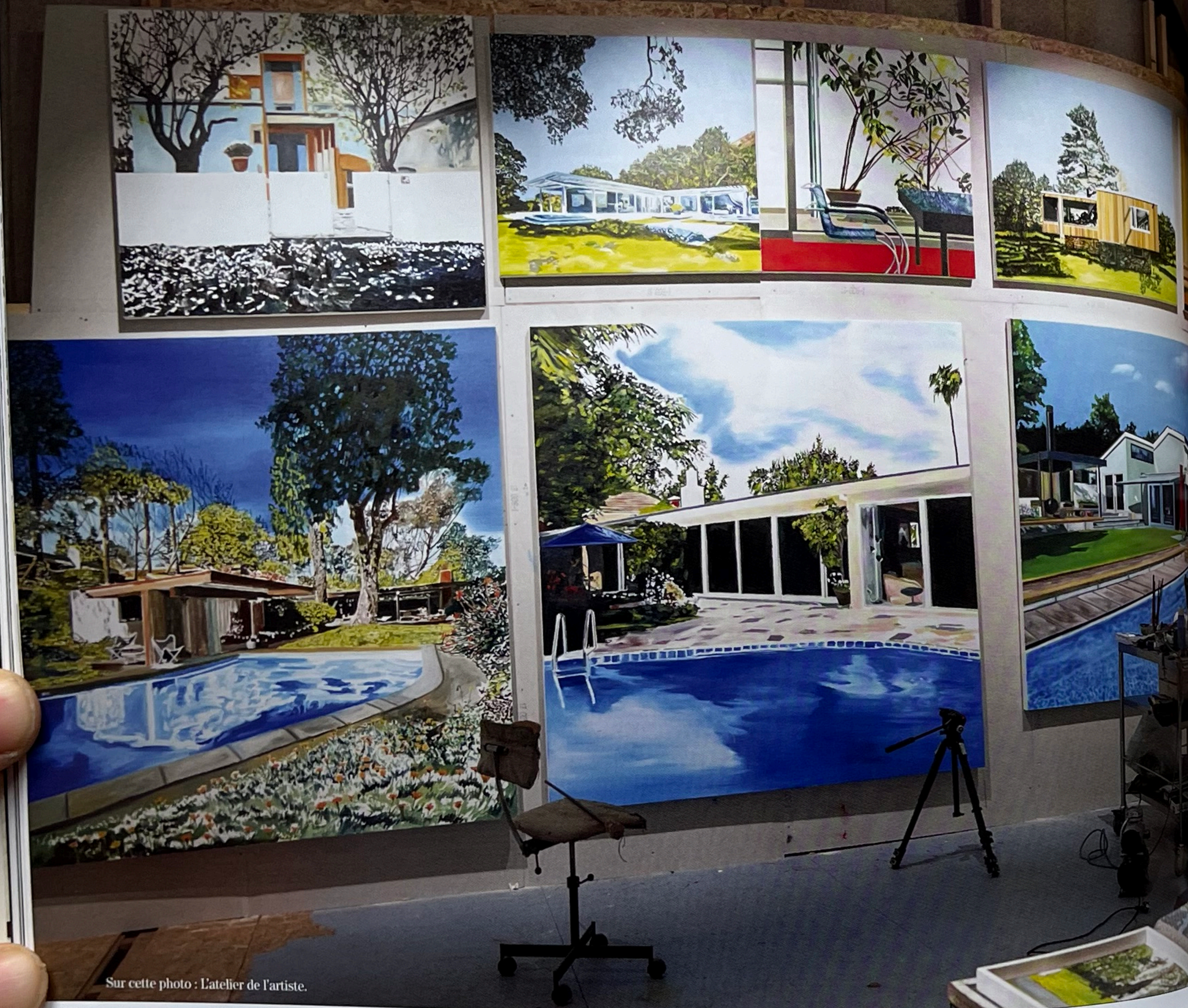
Sur cette photo : L'atelier de l'artiste.