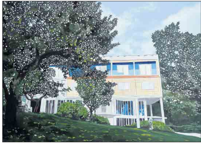
BETATT: Eamon O'Kane er åpenbart betatt av de rene formene vi finner hos de modernistiske arkitektene.