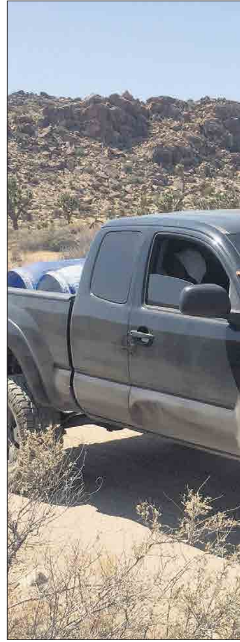
DET MODERNE TROLL: Trollet er en gjenstand i en ørken, som dypt inne i skogene.

Videoinstallasjonen «Your Next Vacation is Calling» er hovedverket i utstillingen. Tre digre skjermer omgir og